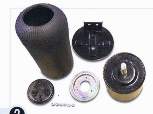
2 消耗品を新品に交換 再利用可能な部品は塗装してオーバーホール