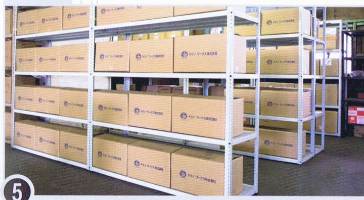
5 一つ一つダンボールに入れ、 徹底した在庫管理