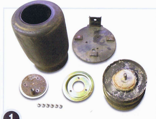
1 古コアを確認して 錆や塗装を落とします

これまでテクノワークスが培ってきた技術を駆使し、徹底した管理の元に、最高品質のリビルトを行っております。