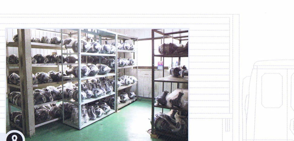
8 200~300種のチャンバ在庫有り

御注意 ◎このリリースポルトは車両取り付け後外してください 先に外してしまいますと中のスプリングが伸びてしまい装着ができなくなります リリースポルトはエア圧0.7MPaで設定しています