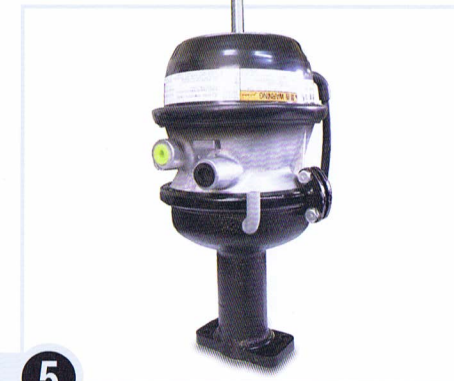
5 ピギーバック付チャンバ完成