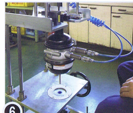
6 ナブテスコ専用テスターにて検査