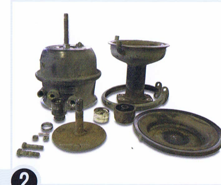
2 解体した部品を確認して錆や塗装を落とします。